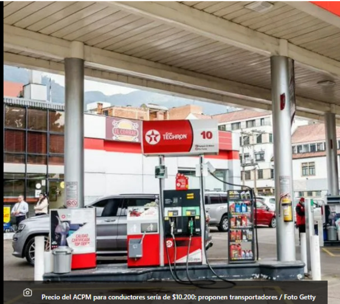
Precio del ACPM para conductores sería de $10.200: proponen transportadores