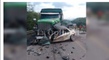
Mortal accidente en el Anillo Vial Occidental de Cúcuta