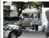
'Uzi', el sicario que cobraba hasta $20 millones por matar en Cúcuta