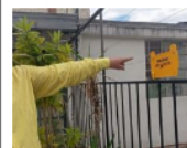
¿Qué es lo que tiene atrincherados en sus casas a los vecinos de tres barrios de Cúcuta?