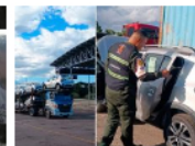
Así fue la jugada maestra en el mercado de vehículos hacia Venezuela