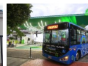
Arrancó el primer bus eléctrico de Cúcuta con ruta patrimonial