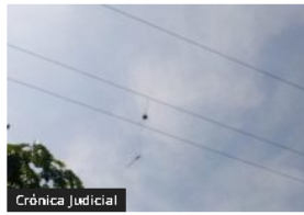
Crónica Judicial En inmediaciones de la Vía al Mar Denuncian vandalismo a redes eléctricas en zona rural de Punta Astillero