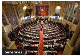
Generales Reforma a la Salud un 75% del proyecto ha sido aprobado en la Cámara