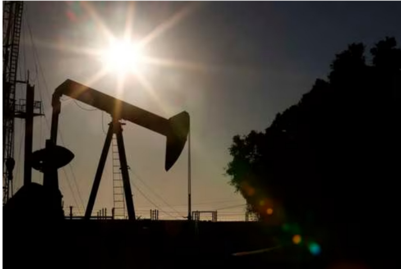
El área petrolera del país está toda concesionada.

Únete a nuestro canal de Whatsapp y recibe las noticias más importantes X