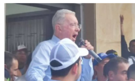
Álvaro Uribe Vélez lanzó críticas a Gustavo Petro durante su visita a Bucaramanga