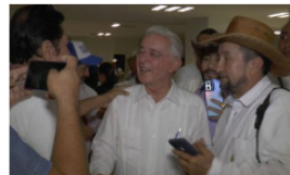
De visita en la ciudad está el expresidente Álvaro Uribe