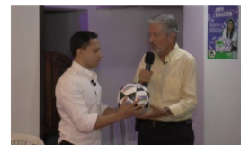
Diputado Leónidas Gómez ratificó su apoyo al candidato Paul Solórzano