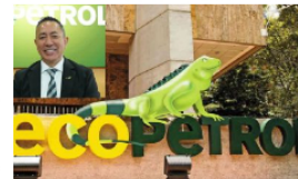
Ecopetrol invertirá $767 mil millones para impulsar la transición energética