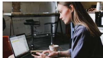
El 70% de los trabajadores están a favor de la flexibilidad de las nuevas formas de trabajo