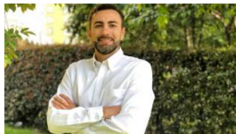
Las urbanizaciones ilegales, una problemática social, económica y ambiental.