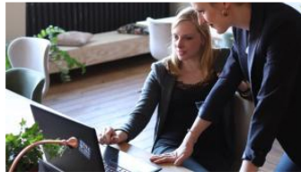
BBVA se propone llegar al 35% de mujeres en puestos directivos en 2024