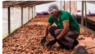
Natura lanza herramienta que monetiza los resultados sociales, humanos y ambientales