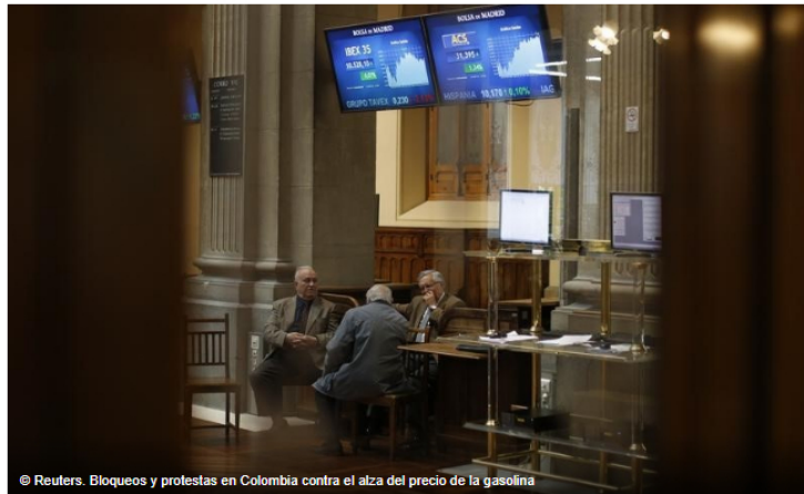
Bloqueos y protestas en Colombia contra el alza del precio de la gasolina