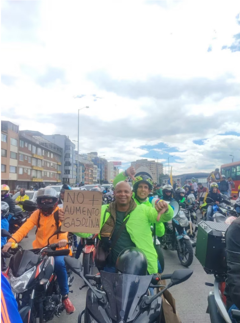
Motociclistas sobre la calle 26 protestan contra el alza de la gasolina

Bogotá - Las manifestaciones en Bogotá se adelantan sobre la calle 26 hacia el oriente. También se presentan camiones en plantón frente al Ministerio de Transporte