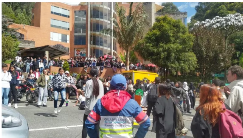
Autoridad acompañan a los protestantes

Bogotá - Autoridades de Tránsito indicaron cierre preventivo de la avenida Circunvalar con calle 12D por manifestaciones. Uniformados se encuentran en el punto para realizar el acompañamiento. Los manifestantes realizan bloqueo total de la calzada, la Secretaría de Movilidad sugiere tomar vías alternas para evitar embotellamientos.