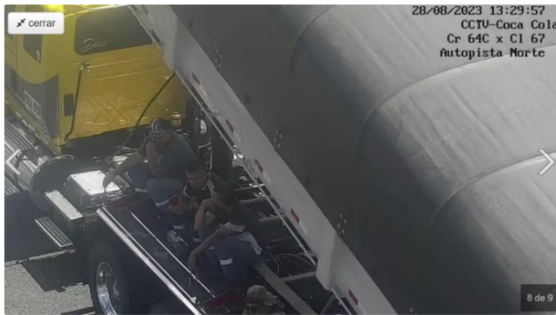
Camioneros realizan plantón en la Autopista Norte de Medellín y provocan cierre de los carriles