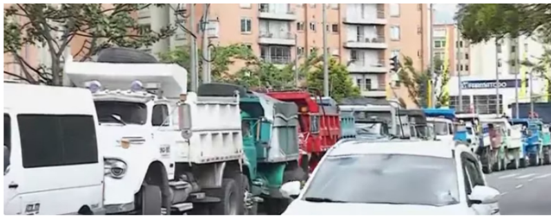
Gremio de camioneros se encuentran situados al frente del Ministerio de Transporte