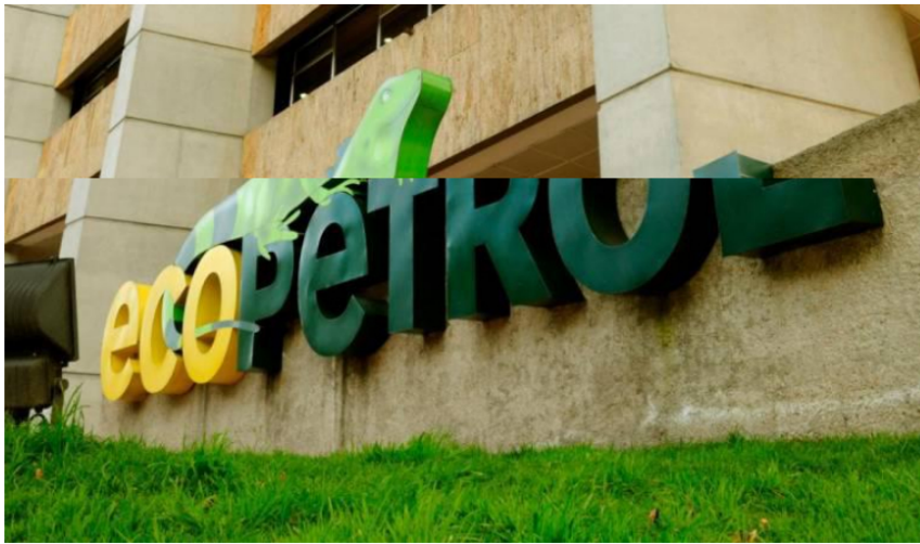
Según la petrolera, se podrán en marcha 1.180 iniciativas y proyectos en 572 municipios, con una cobertura equivalente al 52% del territorio nacional.

El portafolio de inversión social de la compañía contempla 1.180 proyectos en tres grandes focos: educación, servicios públicos y diversificación de las economías regionales.