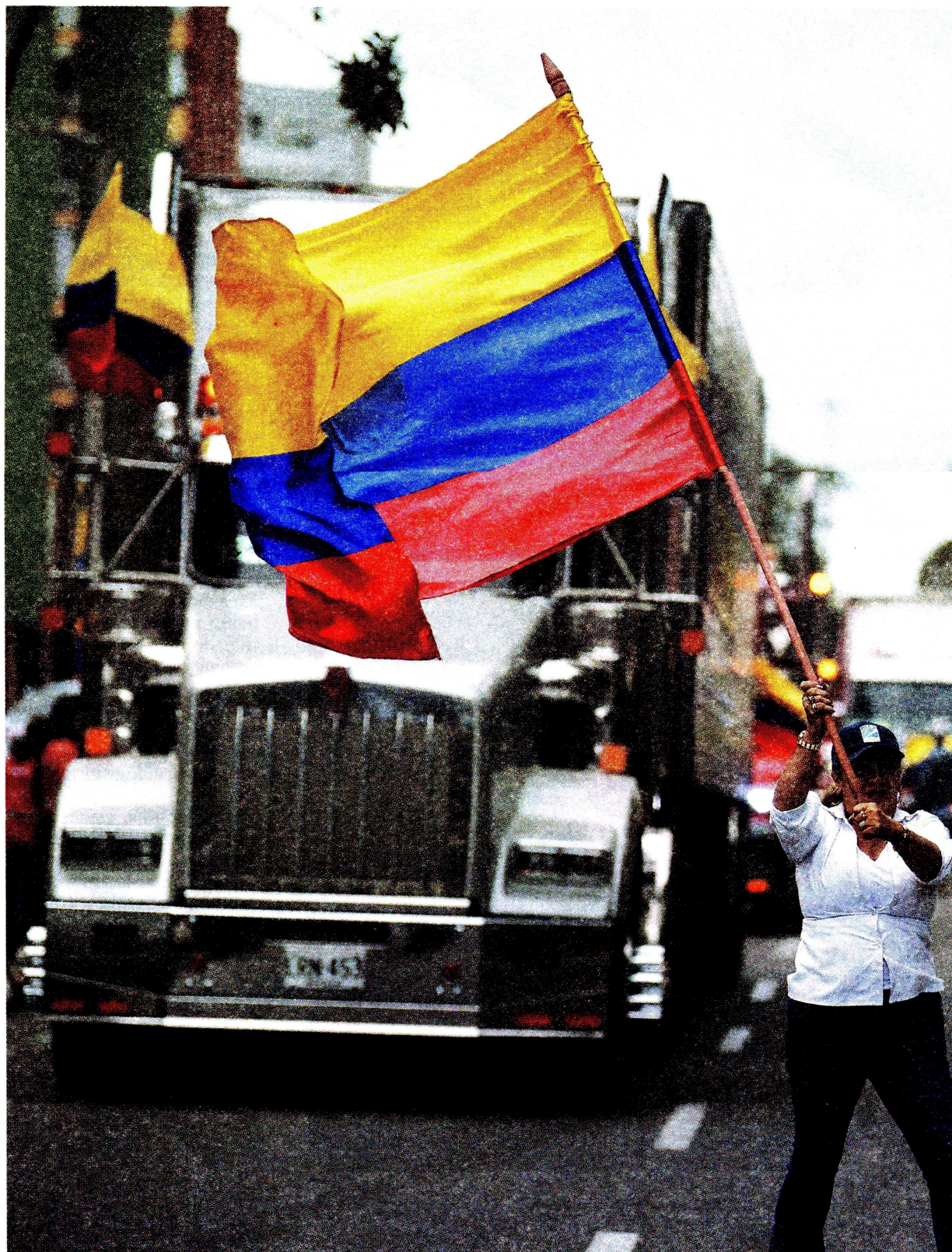
El lunes, sindicatos de transportadores protestaron en las ciudades principales del país.

Respecto al diésel, las tarifas están congeladas con el argumento de que es el combustible que mueve a los vehículos de carga, actores