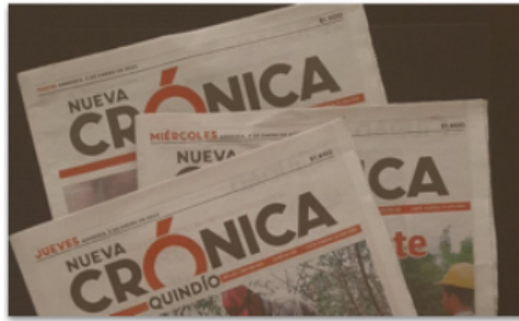
Opinión Sin ambiente para acuerdo nacional