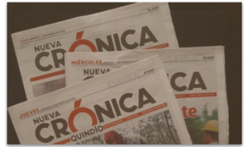
Opinión La subsistencia del mercado de vivienda en el Quindío