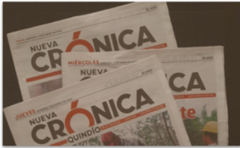
Opinión La extensión de las hostilidades