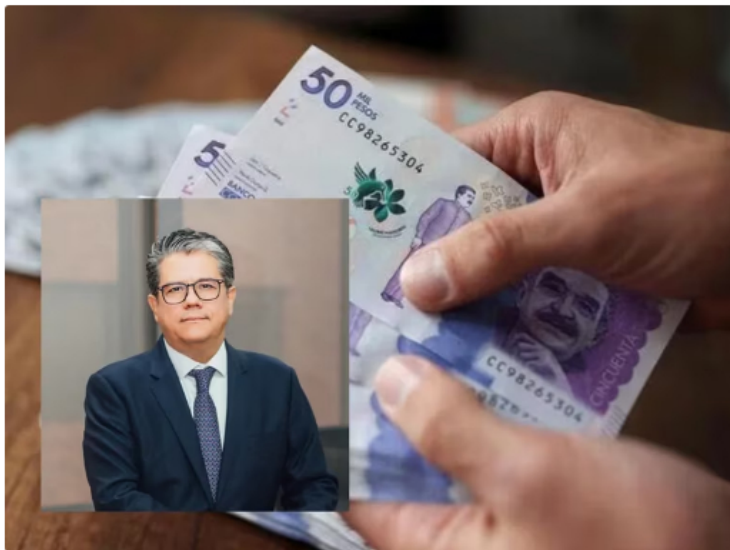
Germán Arce, presidente del Consejo Gremial Nacional y exministro de Minas y Energía - crédito Consejo Gremial Nacional.

“Si la energía no entra, entonces terminamos perdiendo más térmica, emitiendo más CO2 y entonces ahí el discurso hay que alinearlos con la ejecución y en eso el sector tiene unos desafíos desde hace varios años, y es que no hemos podido incorporar esas nuevas fuentes de energía en proyectos que ya están subastados, tienen financiamiento, tienen cargos y no han podido entrar en operaciones. Necesitamos que los problemas se resuelvan para que esta historia tenga contenido, para que esos kilovatios limpios entren a la matriz”, resaltó.