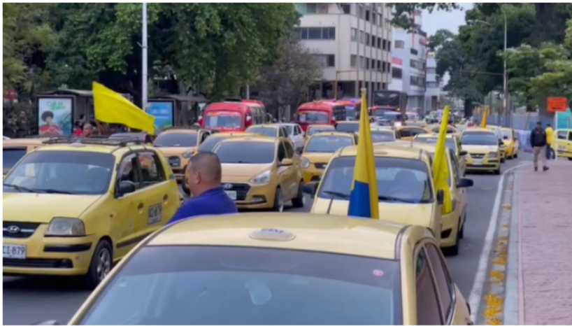
En la vía Cali-Yumbo, los taxistas adelantan plan tortuga desde las 5:00 a.m. de este miércoles, 9 de agosto.

Cabe resaltar que en la reunión que se llevó a cabo este viernes, Gustavo Petro y los taxistas, acordaron revisar la posibilidad de una tarifa diferencial en el combustible para ese gremio, una aplicación única y más apoyos.