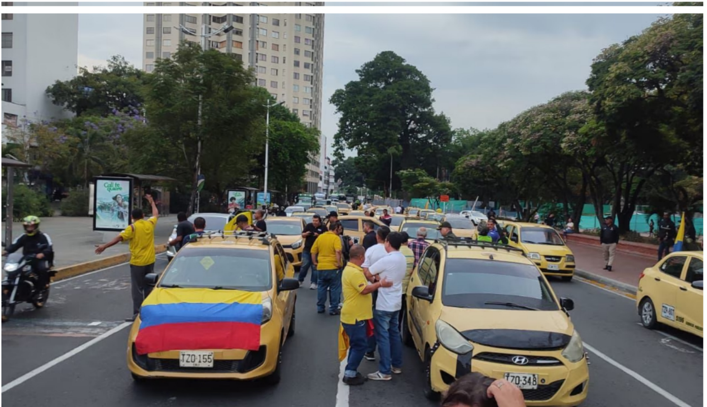
Una nueva movilización, principalmente de taxistas, se desarrollará en Cali y otras ciudades este lunes 28 de agosto.

27 de agosto de 2023 Por: Redacción El País