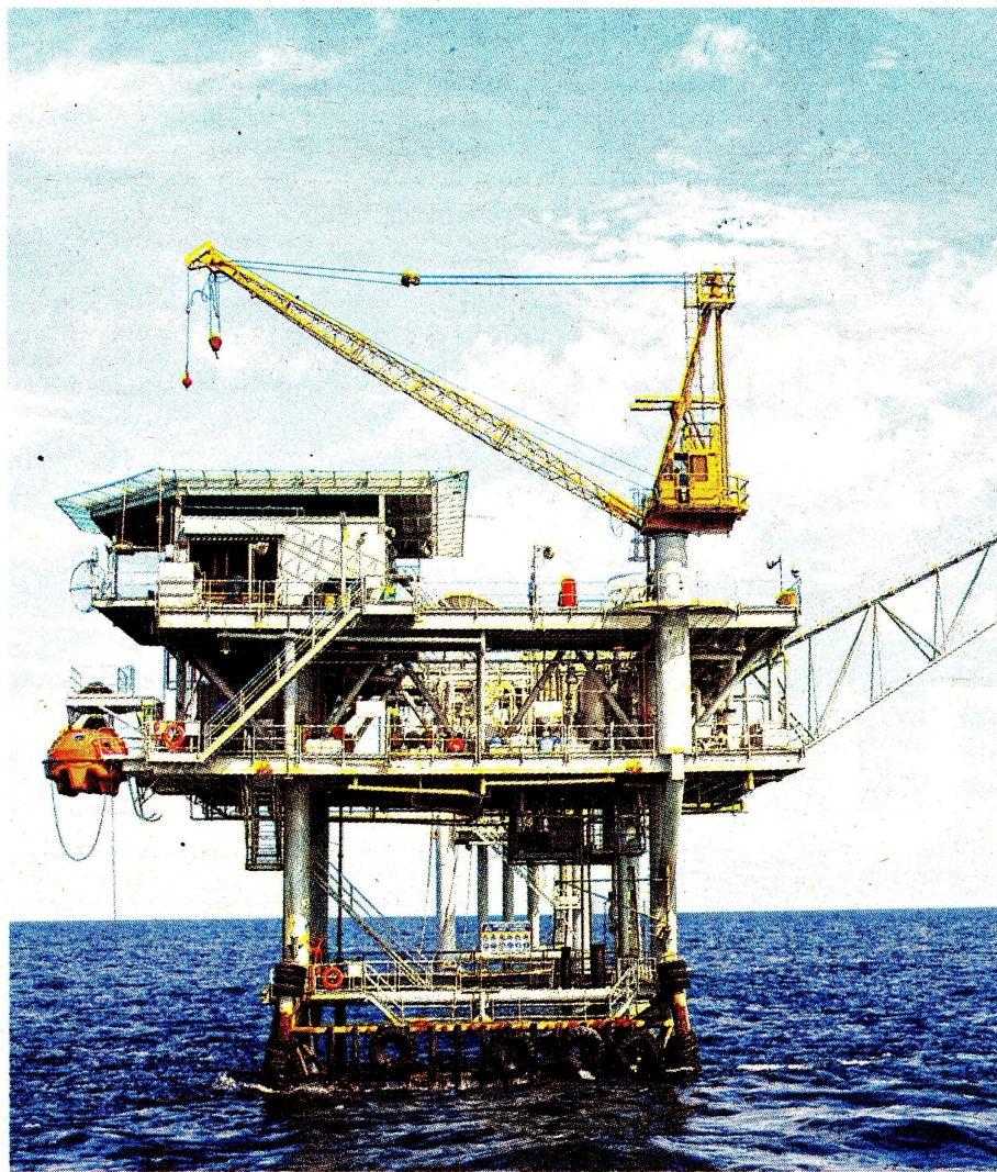
La Guajira tiene en Chuchupa uno de los campos de petróleo y gas más grandes en la región Caribe.