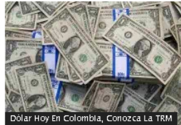
Dólar Hoy En Colombia, Conozca La TRM

Declaración de renta en Colombia: este será el cambio clave desde el 18 de septiembre