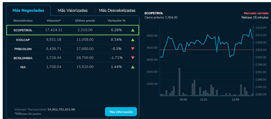
En cuanto a las acciones más valorizadas en la jornada, preferencial Grupo Argos lideró la lista con un aumento del 3.33 %.

Además de los movimientos en la Bolsa de Valores y la espera de las declaraciones de Jerome Powell en el Simposio de Jackson Hole, los inversionistas en el contexto local también mantienen una mirada atenta sobre el recién radicado proyecto de reforma laboral en el Congreso de la República. Esta iniciativa ha generado una fuerte polémica en el ámbito económico y empresarial, ya que mientras el Gobierno nacional la defiende como una vía para promover la equidad laboral y la formalización, los empresarios