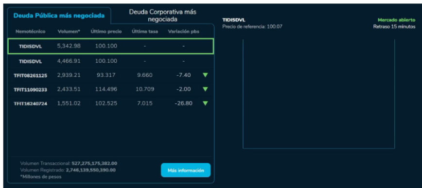
Pasando lista a las negociaciones de deuda pública y corporativa, se observaron movimientos significativos.

Pasando lista a las negociaciones de deuda pública y corporativa, se observaron movimientos significativos. En el caso de la deuda pública, los títulos TIDISDVL lideraron las negociaciones con un volumen de 5,342.98 millones y un último precio de 100.100. Por otro lado, en el ámbito de la deuda corporativa, los títulos TIDISDVL también se destacaron con un volumen de 4,466.91 millones y el mismo último precio de 100.100. Es importante resaltar que las variaciones en las tasas de interés para estos títulos no fueron reportadas en el momento.