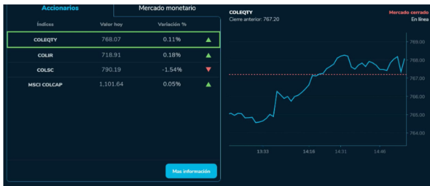
En el ámbito accionario, los índices mostraron resultados mixtos al cierre.

Última hora | Eduardo Lara fue sometido a cateterismo tras sufrir un infarto: aquí el parte médico del estratega