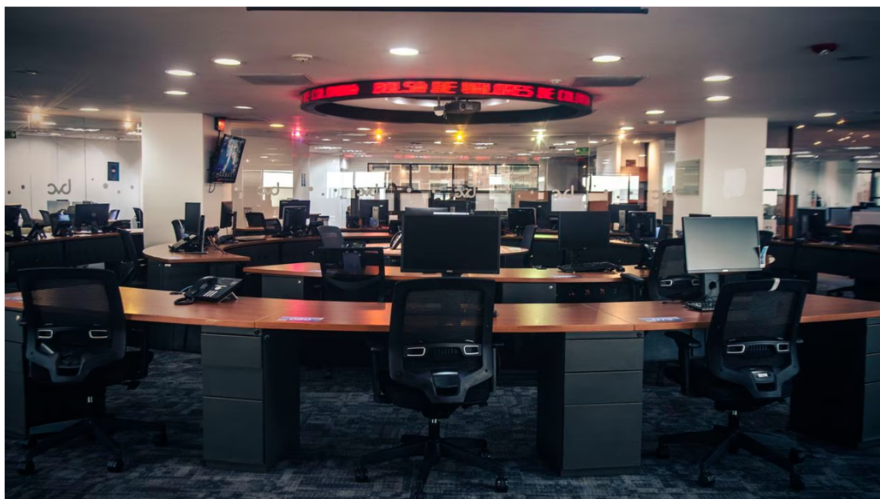
Por ahora los mercados respiran con tranquilidad y fijan su atención en lo que vendrá para septiembre.

La Bolsa de Valores de Colombia y Ecopetrol cerraron la semana con movimientos dispares, reflejando la cautela de los inversionistas ante los anuncios y perspectivas económicas presentadas por la Reserva Federal de Estados Unidos (Fed) en el Simposio de Jackson Hole. Aunque la jornada estuvo marcada por cierta volatilidad, algunos indicadores lograron modestos repuntes, mientras que otros experimentaron retrocesos. Además, la petrolera estatal Ecopetrol fue uno de los protagonistas de la jornada al mostrar un incremento en su valor.