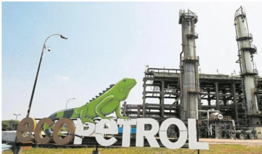
Ecopetrol.