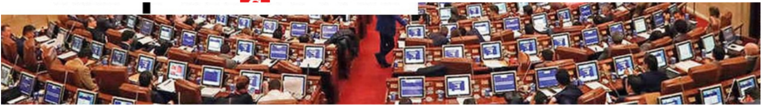
Reforma pensional | Foto: Llegó la hora cero: empieza debate de reforma pensional

Convierta a Semana en su fuente de noticias aquí