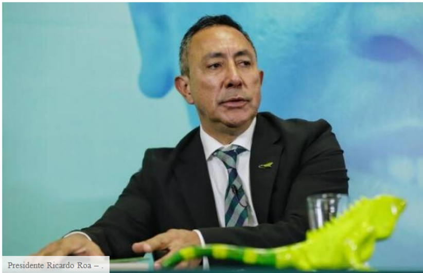
Presidente Ricardo Roa - .