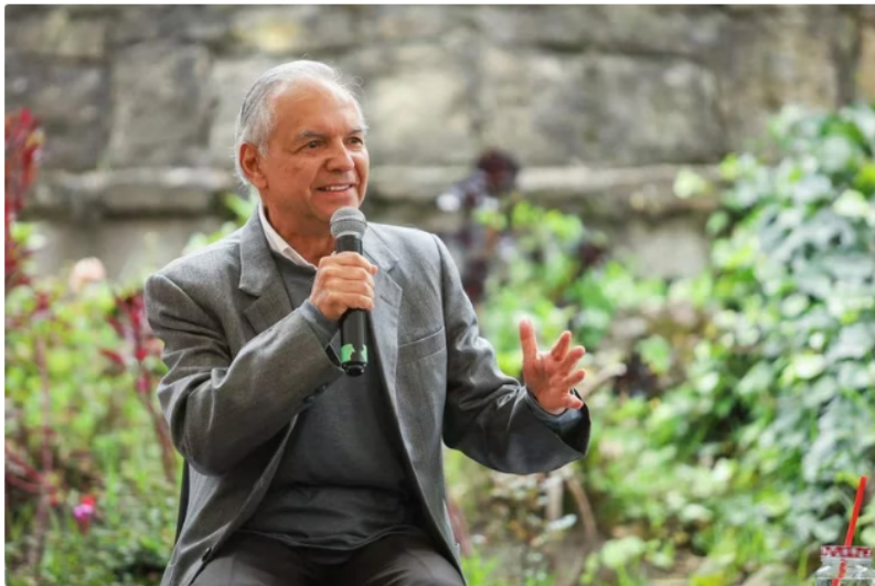
Ricardo Bonilla, nuevo ministro de Hacienda, reiteró el apoyo del Gobierno con la infraestructura vial en Bogotá y se refirió a las cinco líneas subterráneas que deben consolidarse.

Luego de las comisiones económicas en el Congreso de la República, Ricardo Bonilla, ministro de Hacienda , presentó el Presupuesto General de la Nación (PGN) para el 2024, que supera los $500 billones.