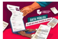
EscarbaData Data Pública: ¡Datos abiertos para tutti mundi!