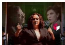
EscarbaData Si con Name llueve, con Lozano no escampa