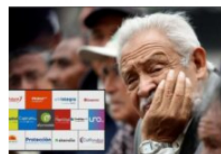
EscarbaData Reforma de pensiones: el modelo de las AFP que fracasó en Latinoamérica