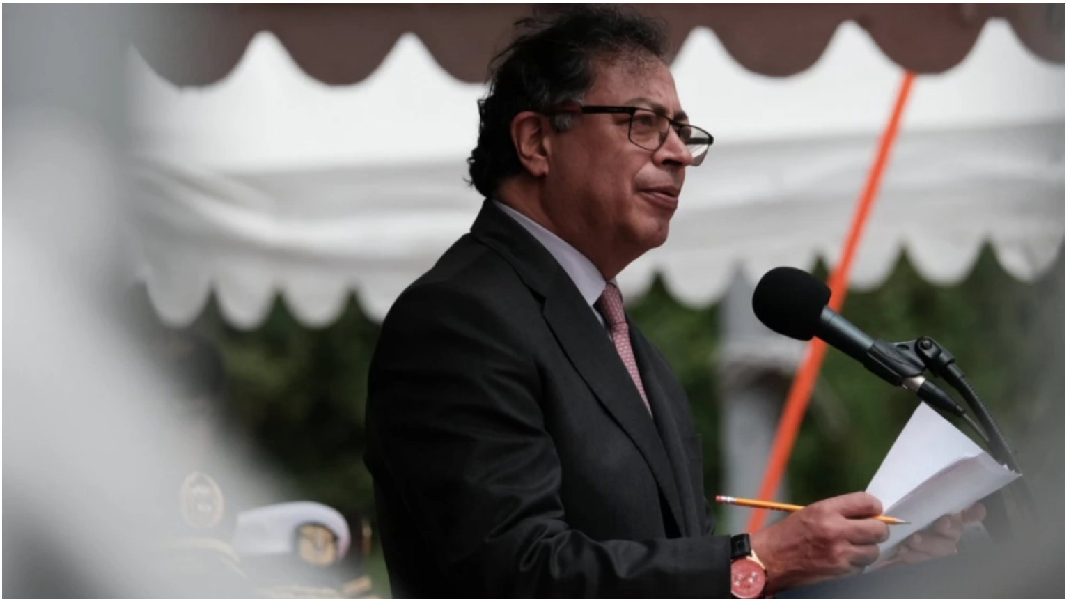
Gustavo Petro

Dos de los escándalos que han salpicado recientemente al gobierno del presidente Gustavo Petro, han tenido desarrollo en las últimas horas.