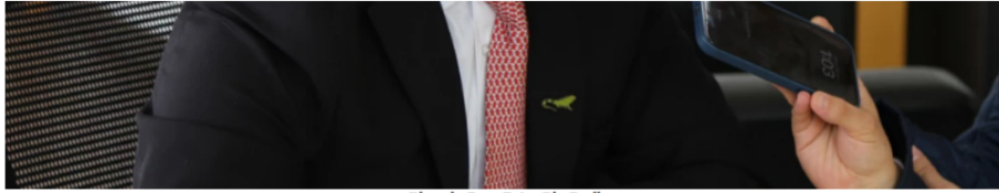
Ricardo Roa