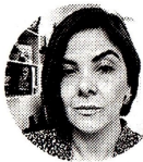
Jhenifer Mojica Ministra de Agricultura y Desarrollo Rural

“No se trata de facultades expropiatorias, no es la expropiación exprés, son facultades administrativas de la ANT en torno a la finalidad trazada de que la propiedad cumpla una función social”.