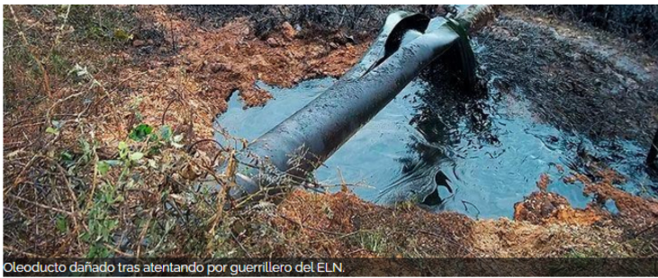
Oleoducto dañado tras atentado por guerrillero del ELN.