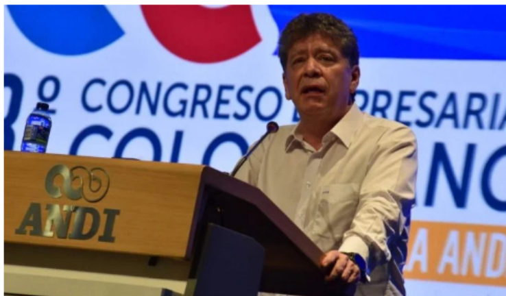
Así fue el congreso número ocho de la ANDI en Cartagena.

En Cartagena se realizó el octavo Congreso Empresarial Colombiano (CEC) de la Asociación Nacional de Empresarios de Colombia (ANDI) , este evento de tres días presentó una agenda muy variada.