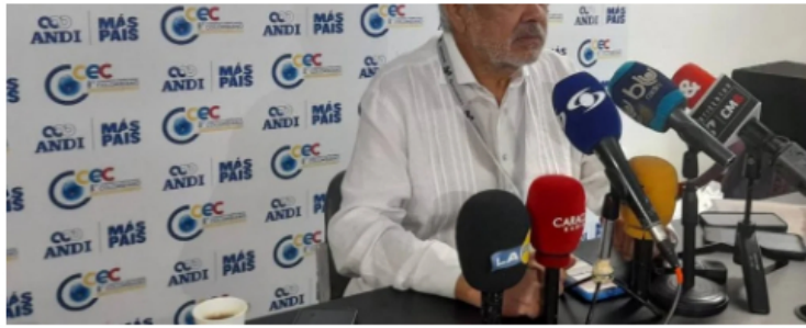
Mincomercio se refiere al TLC con EE.UU.

Un tratado que lleva once años en el intercambio de mercancías entre los países.