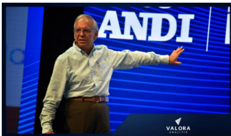
Ricardo Bonilla, ministro de Hacienda, habla del TLC entre Colombia y Estados Unidos.

En el segundo día la atención se centró en el ministro de Hacienda, Ricardo Bonilla y el Fiscal General de la Nación, Francisco Barbosa.