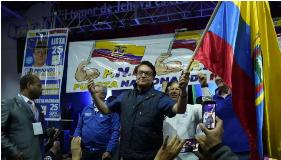
El candidato presidencial Fernando Villavicencio participa en un mitin de campaña