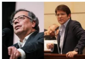
Gustavo Petro le da una píldora para la memoria a Miguel Uribe Turbay