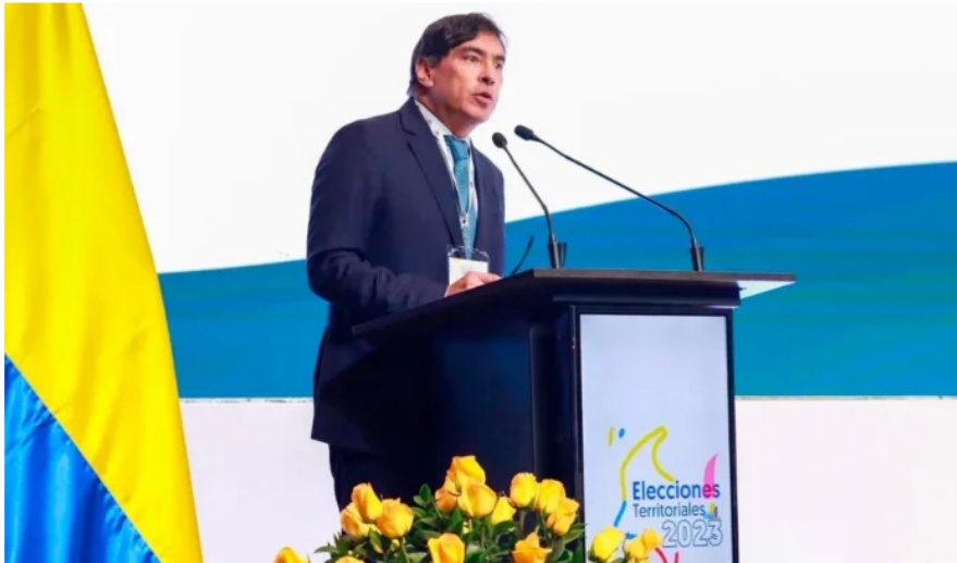
Álvaro Hernán Prada mandó a investigar la campaña Petro Presidente.

Un magistrado electoral que está procesado penalmente por reclutar testigos falsos para Álvaro Uribe Vélez ordenó examinar las cuentas de los dirigentes del Pacto Histórico y otros partidos involucrados en la administración de la campaña 'Petro-presidente' en busca de pruebas de aportes ilegales.