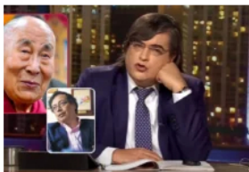
Jaime Bayly: la verdad es que Petro ha quedado como el Dalái Lama