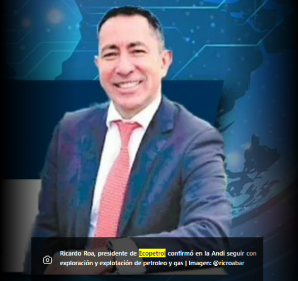
Ricardo Roa, presidente de Ecopetrol confirmó en la Andí seguir con exploración y explotación de petróleo y gas