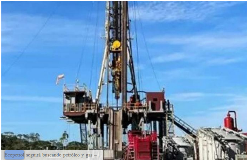
Ecopetrol seguirá buscando petróleo y gas - .