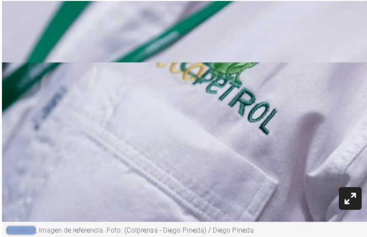
ecopetrol, imagen de referencia.

Así lo hizo saber la petrolera en cinco vicepresidencias.