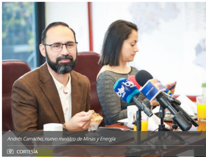
Andrés Camacho, nuevo ministro de Minas y Energía

El titular de la cartera, Andrés Camacho, dijo que se encuentra preocupado por este tema y que seguirá con las políticas bajo la dirección de Vélez.