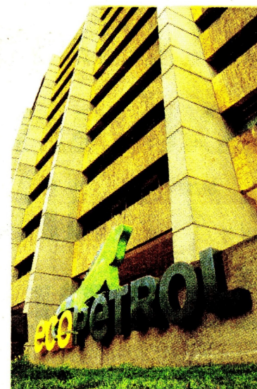
La decisión se tomó en una sesión de la junta directiva.

“Ese tiempo se da porque para poder solicitar un desembolso, se necesitan ejecutar varios procesos para que se pueda desembolsar un subsidio”, explicó Herrera.