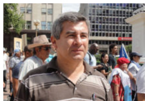
El ataque de la ultraderecha