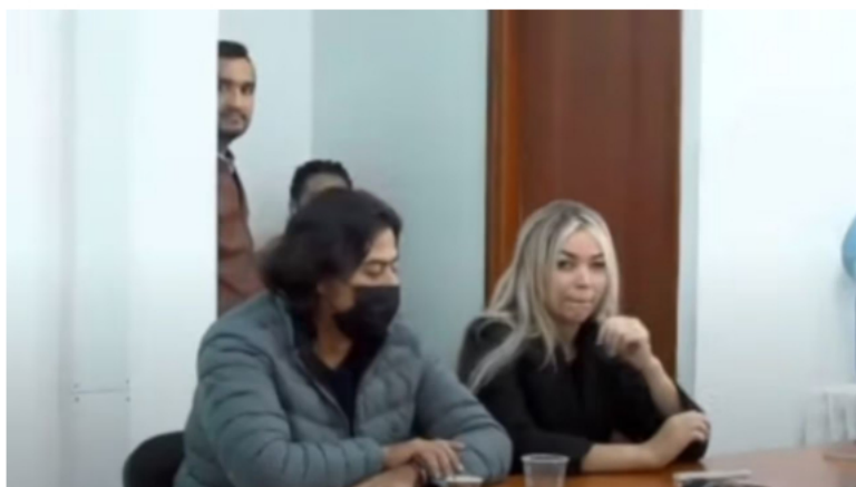
Nicolás Petro y Day Vásquez en audiencia del viernes 4 de agosto sobre medida de aseguramiento

"Hay que prevenir porque vivimos en un país en donde todos sabemos que la inseguridad es muy alta. No es solamente un capricho mío, fue una orden del juez. Ustedes lo pueden verificar en audiencia", agregó el abogado, que pidió que se garantice su seguridad.