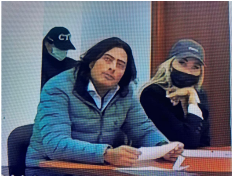
Audiencia de Nicolás Petro y su ex esposa Day Vásquez.

“El despacho accederá en el caso concreto suyo a esas medidas no privativas de la libertad que durarán durante todo el proceso, previa suscripción de diligencia de compromiso con el despacho” , precisó el juez de control de garantías.