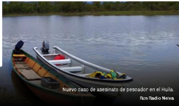
Nuevo caso de asesinato de pescador en el Huila. Rcn Radio Neiva

comerciante de pescado en Puerto Seboruco, en jurisdicción del municipio de Campoalegre, donde usualmente se reúnen varios pescadores para realizar su trabajo y pasar el tiempo.