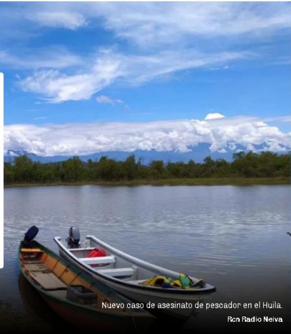
Nuevo caso de asesinato de pescador en el Huila. Rcn Radio Neiva