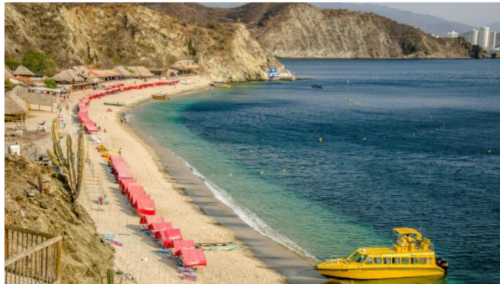
Aspecto de Santa Marta, en Pozos Colorados.

“Aunque la Ley de Distritos establece que debe emitir un concepto vinculante en casos como este, la alcaldesa ha permanecido en silencio. Esta falta de pronunciamiento nos lleva a pensar que se ignoran las preocupaciones locales en la toma de decisiones”, agregó el líder cívico.