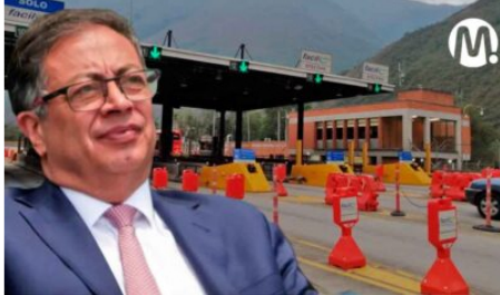
Para terminar la vía al Llano, planean instalar nuevo peaje o subir tarifas