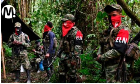
“Lo estamos estudiando”: ELN sobre fin del secuestro y la extorsión