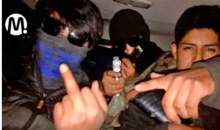
Hasta $1 millón pagaría el Gobierno a jóvenes que dejen de delinquir