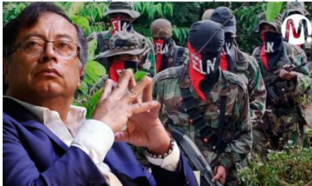
Petro suspende operaciones militares contra el ELN