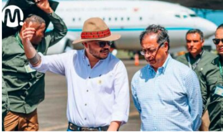
«Hay que ejecutar»: el llamado de atención de Harman al Gobierno nacional