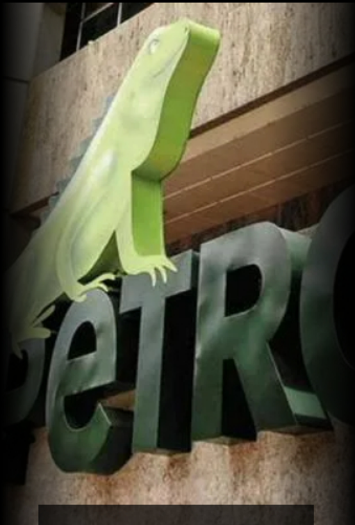
Imagen del logo de Ecopetrol/Cenet DataiFX