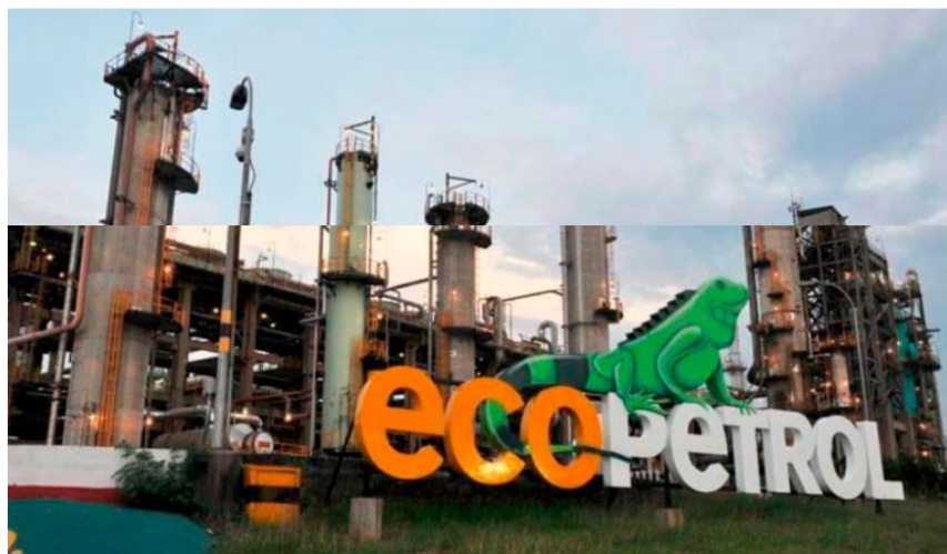
Este es un hito en la exploración de hidrocarburos para Ecopetrol , ya que es el primer pozo en aguas profundas operado directamente por la empresa.

Los trabajos de la plataforma de perforación se desarrollarán en el último trimestre de este año. Si resulta exitoso, se hará el tendido de una línea de conducción que permita llevar a tierra el gas.