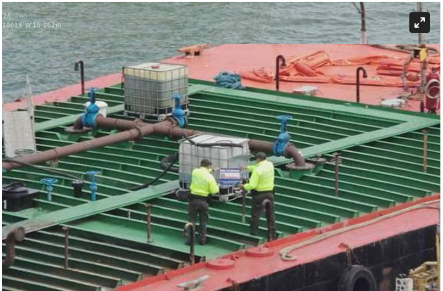
Millonario robo a Ecopetrol.

La operación comenzará en el cuarto trimestre del año de acuerdo con las proyecciones de la petrolera