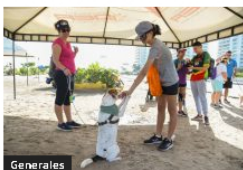
Generales En la ciclovia dominical de Cartagena: