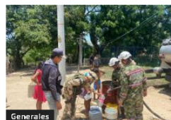
Generales Familias de Monguí reciben agua en