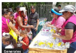
Generales Niños de la Vía Perimetral disfrutaron