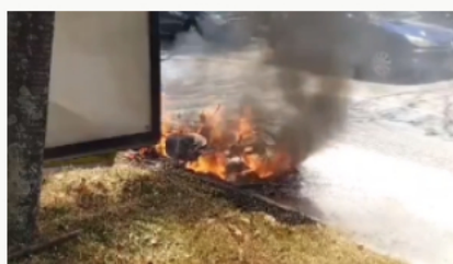
Comunidad incendió moto de ladrón en Medellín