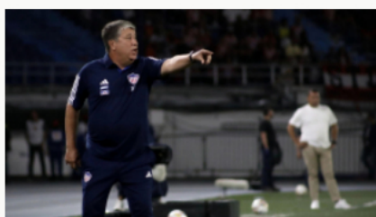
Continúa la crisis en el Junior de Barranquilla