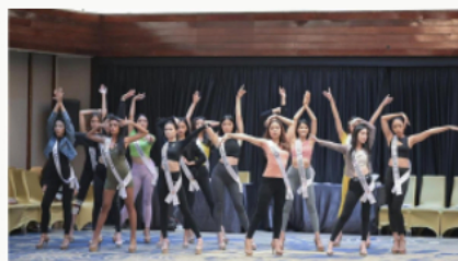
Escándalo en Miss Universo: