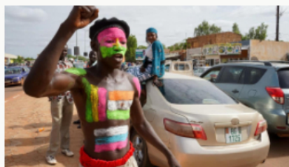
Crisis en Níger: preocupación