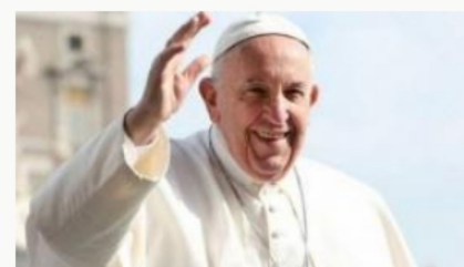
Papa Francisco indicó que han fallecido 2.000 personas en el Mediterráneo