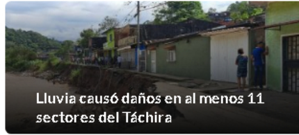
Lluvia causó daños en al menos 11 sectores del Táchira