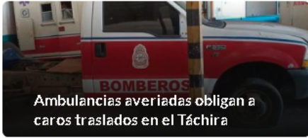
Ambulancias averiadas obligan a caros traslados en el Táchira