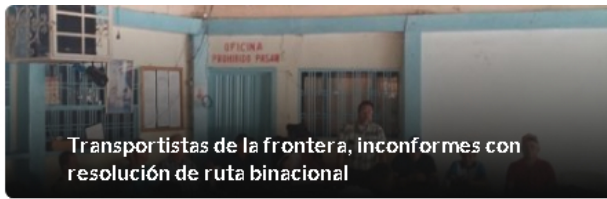
Transportistas de la frontera, inconformes con resolución de ruta binacional