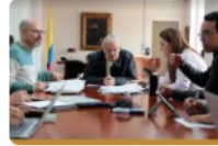
¿Sabe en qué se gastará su dinero del Presupuesto General de la Nación 2024?