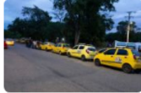
Taxistas esperan encuentro con el presidente Petro