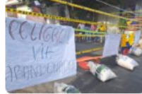
En El Páramo, la comunidad está harta de los huecos