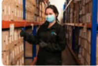
Alcalde puso a salvo la memoria pública del archivo municipal