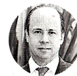
Francisco José Lloreda Presidente saliente de la ACP

AÑOS ES EL PLAZO DE VIDA DE LAS RESERVAS DE GAS CON 2,82 TERAPIES CÚBICOS (TPC), CON DIFERENCIA DE -0,35 CONTRA 2021.