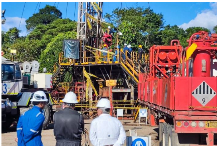
Ecopetrol anuncia un nuevo hallazgo de petróleo y gas en Putumayo

Este anuncio se produjo un día después de que el ministro de Minas, Andrés Camacho, asegurara que se mantendrá la actividad exploratoria.