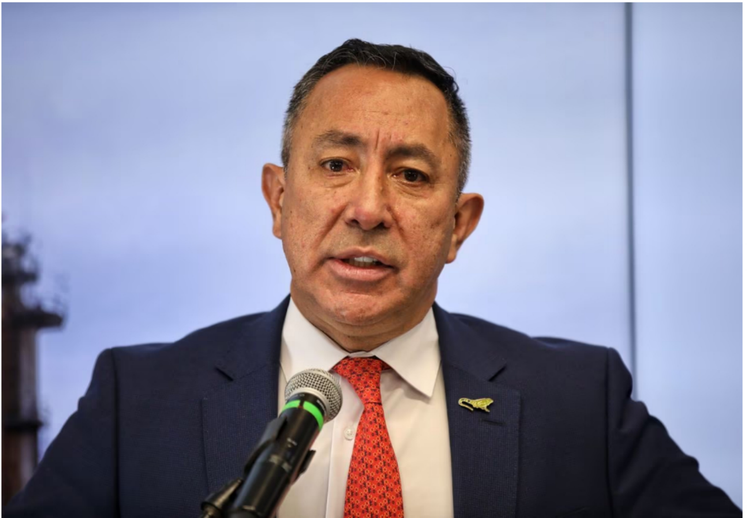
Ricardo Roa Barragán presidente de Ecopetrol.

Se trata de un hidrocarburo liviano, de 31 grados API y la tasa de gas asociado que se produce llega hasta 825.000 pies cúbicos diarios (Kscfd), con un corte de agua menor al 1%. Alqamari-2 está ubicado en un área de operación directa de Ecopetrol S.A, titular del 100 % de los derechos y obligaciones del Convenio de Explotación Área Occidental suscrito con la Agencia Nacional de Hidrocarburos (ANH).