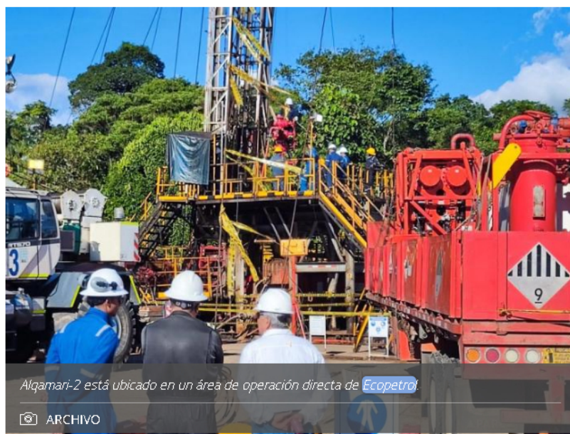
Alqamari-2 está ubicado en un área de operación directa de Ecopetrol

Este descubrimiento tiene una gran ventaja competitiva ya que está ubicado en una zona cercana a campos en producción e infraestructura existente.