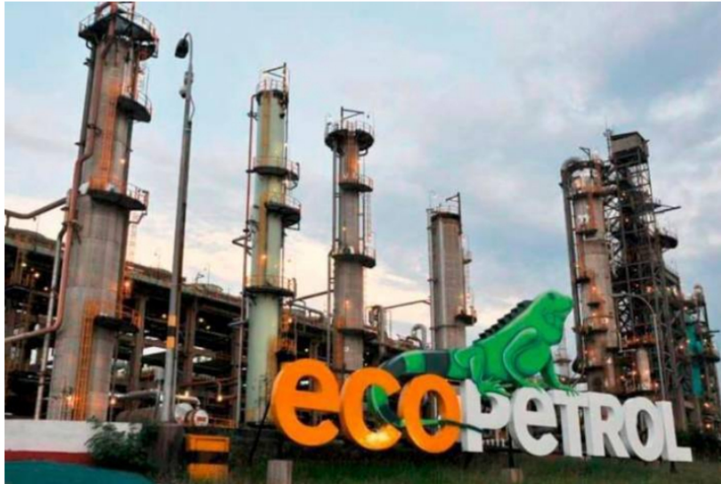
Este miércoles, 9 de agosto, la acción de Ecopetrol cae con fuerza, luego del reporte de caída de las utilidades de 61 %

Un día después del reporte de utilidades, la acción de la petrolera se cotizó en las primeras operaciones en $2,236, con una caída de 5,45 %