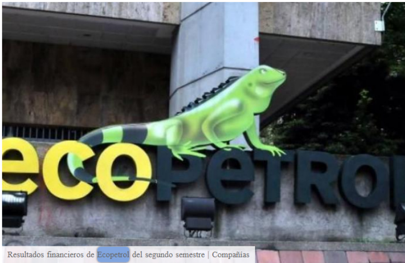
Resultados financieros de Ecopetrol del segundo semestre | Compañías

Ecopetrol, la estatal petrolera, informó sus resultados financieros para el segundo trimestre, período marcado por la caída en el precio internacional del crudo Brent, que afectó sus cifras.